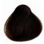
6.41 Louro Escuro Cobre Acinzentado