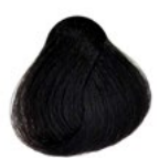
3.0 Castanho Escuro