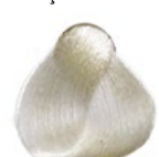
RC 1000 Leite Reforçador de Clareamento