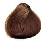
7.4 Louro Médio Acobreado