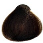
7.7 Louro Médio Marron