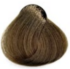
9.0 Louro Muito Claro