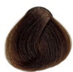
8.31 Louro Claro Bege Acinzentado