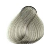
12.01 Extra Blond Acinzentado