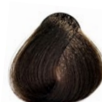
6.7 Louro Escuro Marron