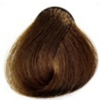
7.3 Louro Médio Claro