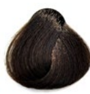
6.0 Louro Médio