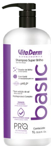
P1213 - Shampoo Super Brilho 1l