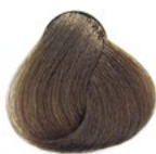
8.0 Louro Clarissimo