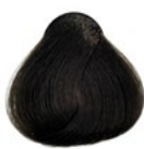
5.0 Castanho Claro