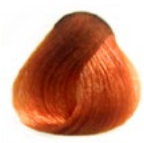
8.44 Cobre Intenso [LANÇAMENTO]