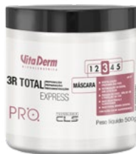
P1188 Máscara 500g

Higieniza os cabelos quebradiços ou danificados de forma segura, de maneira íntegra, e restaura a fibra capilar.