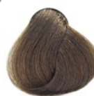
8.0 Louro Claro