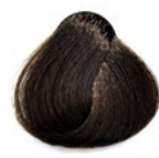
6.0 Louro Escuro