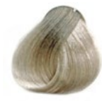
9.89 Louro Muito Claro Pérola [LANÇAMENTO]