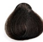
5.3 Castanho Claro Dourado