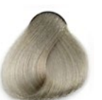
12.12 Extra Blond Platino