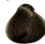
7.12 Louro Médio Bege Perolado