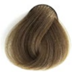
9.13 Louro Muito Cinza Dourado