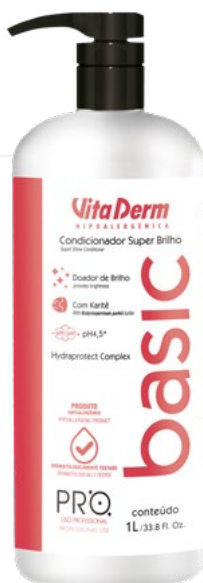
P1215 - Condicionador Super Brilho 1l