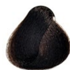
4.77 Castanho Médio Marron Intenso