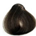
7.1 Louro Médio Acinzentado