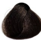
6.1 Louro Escuro Acinzentado