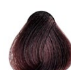
66.62 Red Violeto