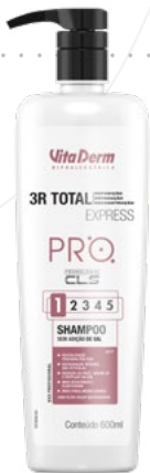
P1186 Shampo 600ml

Higieniza os cabelos quebradiços ou danificados de forma segura, de maneira íntegra, e restaura a fibra capilar.