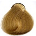
10.0 Louro Clarissimo