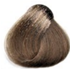
8.1 Louro Claro Acinzentado