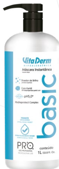
P1216 - Máscara Instantânea 1l