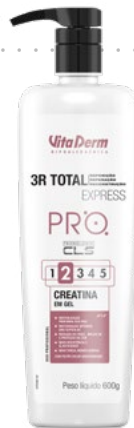
P1187 Creatina em Gel 600g

Potencializa a reconstrução e reparação da cutícula capilar, além de atuar na reposição da massa perdida, reorganizando suas ligações e desenvolvendo força e elasticidade aos cabelos fragilizados.