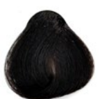
4.0 Castanho Médio