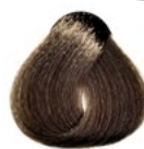
7.0 Louro Médio