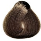
7.0 Louro Médio