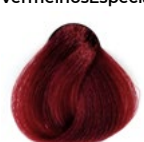
66.66 Rubi Red Intense