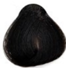
4.0 Castanho Médio