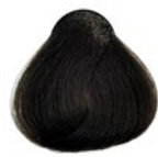
5.0 Castanho Claro