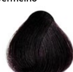
5.20 Beringela Castanho Claro Violeto